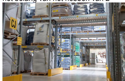
Palletstellingen met onderdoorgangen

product, marktconforme prijs, eigen fabriek en korte communicatielijnen waardoor de kans op fouten wordt geminimaliseerd. Coppens begreep het belang van het hebben van 2